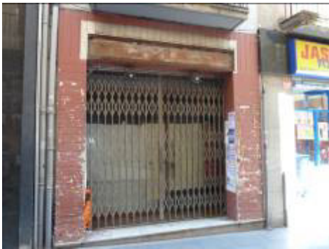
Abans dels treballs